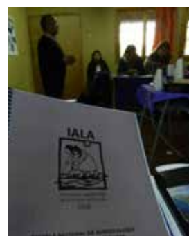
Revistas Biodiversidad, ANAMURI y Libro “Tierra, futuro y esperanza” y Cuadernillos de lecturas obligatorias para las clases de Escuela Nacional