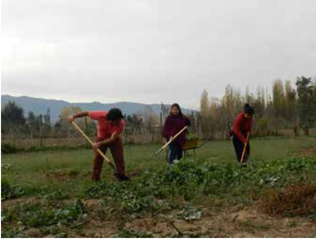
Alumnas y alumno de la Escuela Nacional trabajando en predio de ANAMURI.