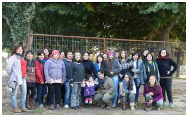
Fotografía grupal primer módulo de Escuela Nacional de Agroecología