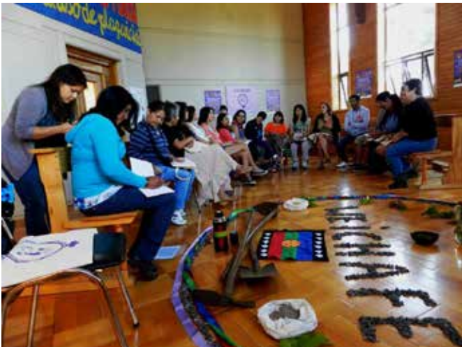
Fotografía de clase de la Escuela Interregional de Temuco