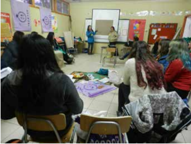
Fotografía de clase de la Escuela Interregional de Canela