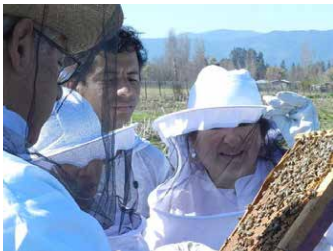
Alumnas en trabajo práctico de apicultura en predio de vecino de la Orilla de Auquenco