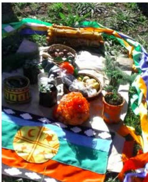
Mística en Escuela Interregional de El Carmen