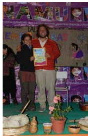
Alumnas recibiendo sus certificaciones