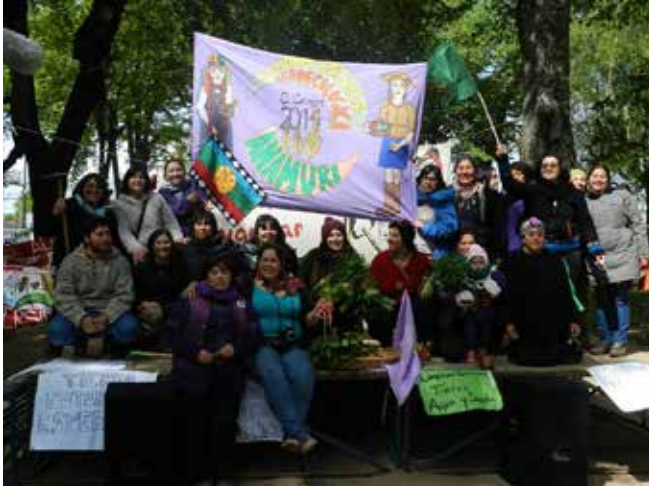
Fotografía grupal Escuela Interregional de El Carmen