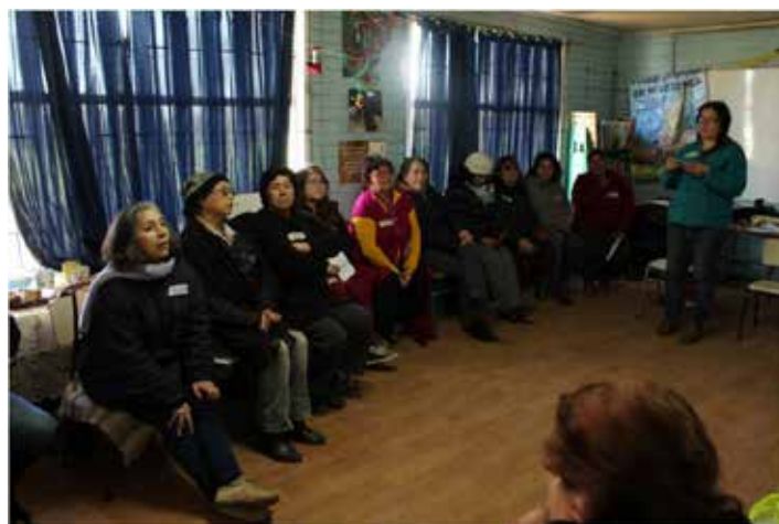
Alumnas de la Escuela Nacional en jornada de difusión de la agroecología, comuna de El Carmen