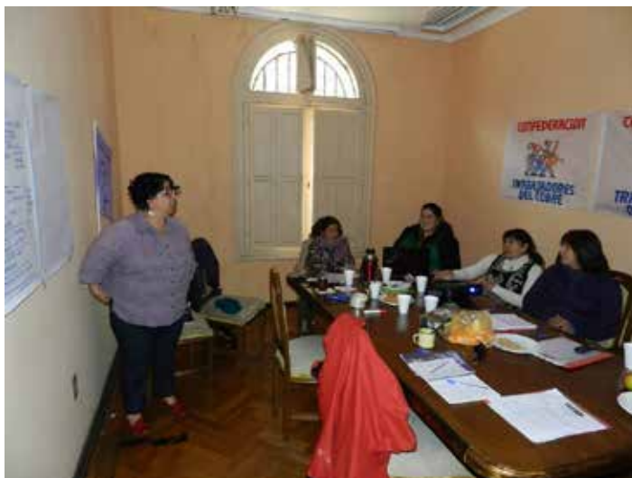
Jornadas de capacitación a formadores de las Escuelas Interregionales