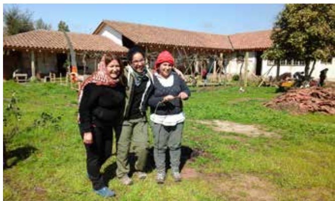
Fotografía de alumnas de la Escuela Nacional en casa de ANAMURI, La Orilla de Auquinco, Comuna de Chépica

Este objetivo de largo plazo se inserta en la misión de ANAMURI que busca contribuir al desarrollo integral de las mujeres rurales e indígenas, considerando los aspectos laborales, económicos, sociales y culturales, a través de la promoción de la asociatividad y del fortalecimiento de sus organizaciones. Todas estas actividades sustentadas en una ideología que apunte a la construcción de relaciones de igualdad en términos de género, clase y pueblos originarios, en un medio ambiente equilibrado entre las personas y la naturaleza.