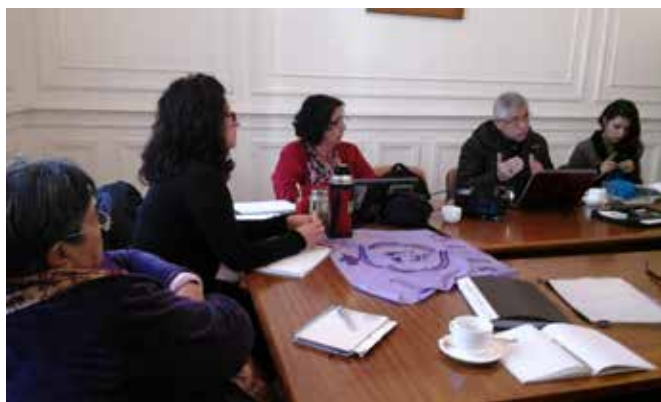
Reuniones preparatorias a los módulos de Escuela Nacional de Agroecología