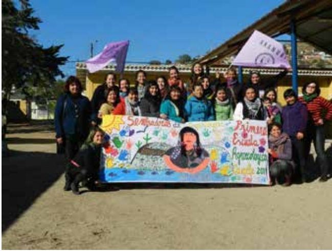
Fotografía grupal Escuela Interregional de Canela