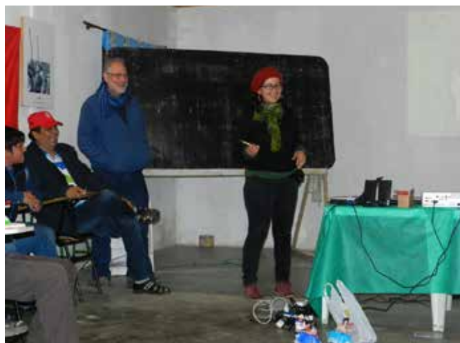
Encuentro de los IALAs en Brasil, Junio 2015