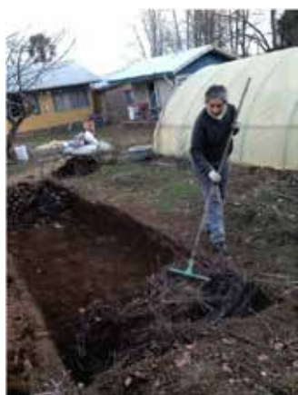
Alumnas de la Escuela Nacional realizando trabajo práctico con su tutora en El Carmen