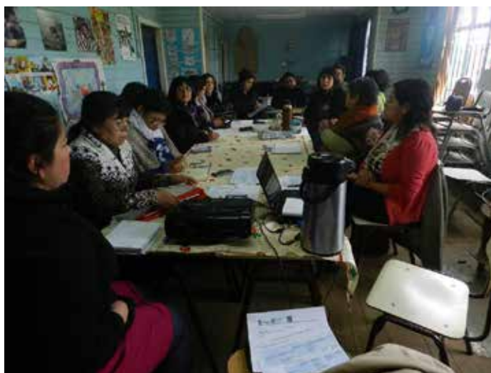
Reunión para la programación de la Escuela Interregional de El Carmen

Al finalizar el ciclo metodológico de las escuelas, se realiza una evaluación en equipo de lo que fueron los módulos de clases presenciales para hacer las adecuaciones pensando en el desarrollo de futuros módulos.