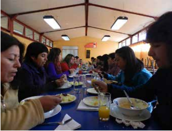
Alumnas de Escuela Interregional de Canela durante el almuerzo