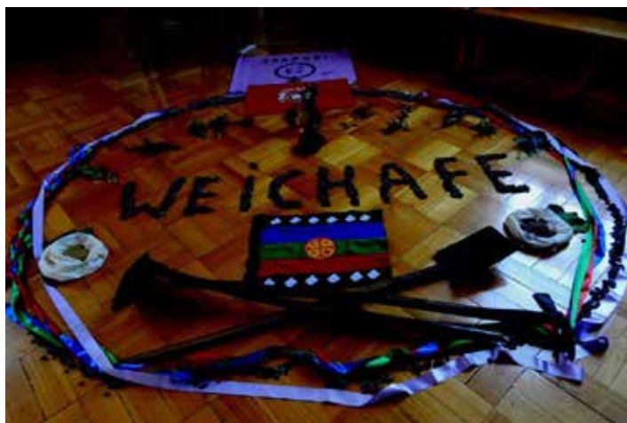
Mística en Escuela Interregional de Temuco