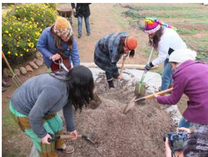
Alumnas de Escuela Interregional de Canela haciendo bocachi en predio de la Asociación de Mujeres Rurales de Canela (AMURUCA)