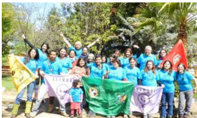
Fotografía grupal sexto módulo de Escuela Nacional de Agroecología

La metodología final para la selección de las alumnas participantes en la escuela nacional considera: