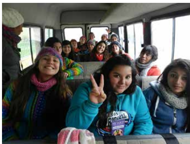
Alumnas de Escuela Interregional de Canela iniciando salida a terreno

Para la Escuela Nacional la alimentación y el alojamiento se han resuelto con vecinas de la localidad de Orilla de Auquingo, quienes durante los seis meses de escuela entregaron en sus casas los servicios necesarios para las alumnas, docentes y equipo IALA.