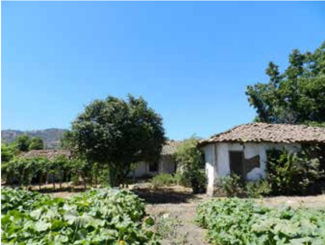
vista de la Casona de ANAMURI.