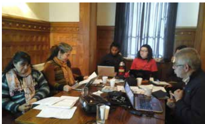
Reuniones de Equipo IALA y Directoras de ANAMURI: