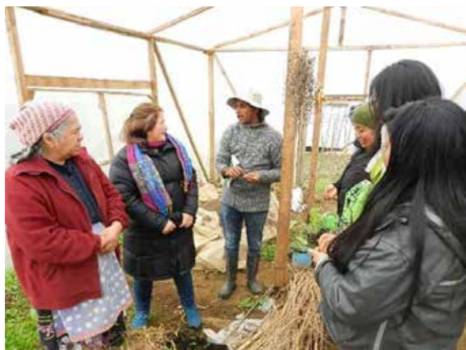
Alumnas de la Escuela Nacional en trabajo con tutor en Temuco