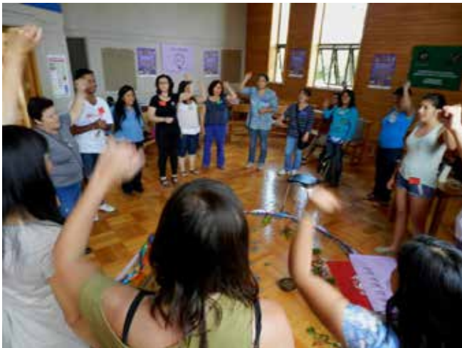
Fotografía grupal Escuela Interregional de Temuco