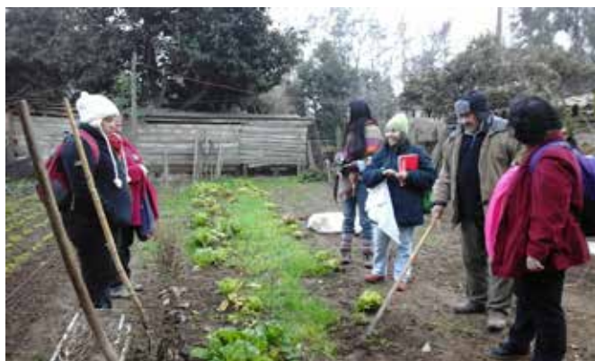
Alumnas visitando huerta de vecino de la Orilla de Auquenco