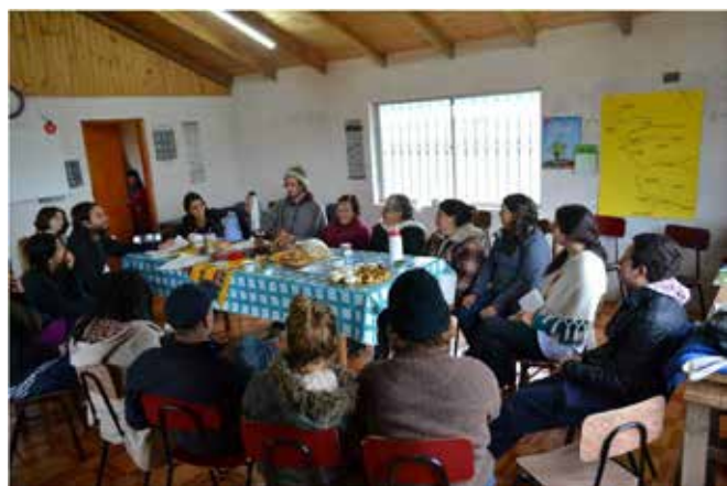
Alumnas de Escuela Nacional realizando tareas de difusión de la agroecología en Curanipe