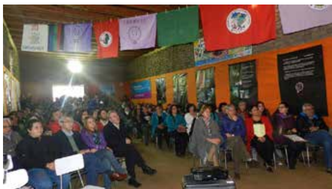
Autoridades Nacionales, Municipales, Alumnas, Directoras de ANAMURI e invitados a la culminación de la Escuela Nacional de Agroecología