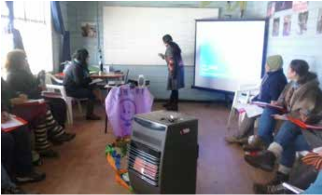
Fotografía de clase de la Escuela Interregional de El Carmen