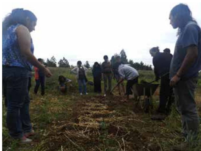
Alumnas de Escuela Interregional de Temuco realizando trabajo de cama alta