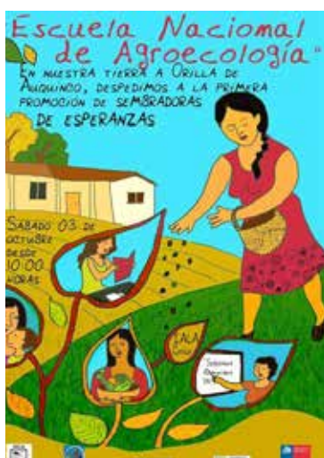
Afiche para cierre de la Escuela Nacional de Agroecología