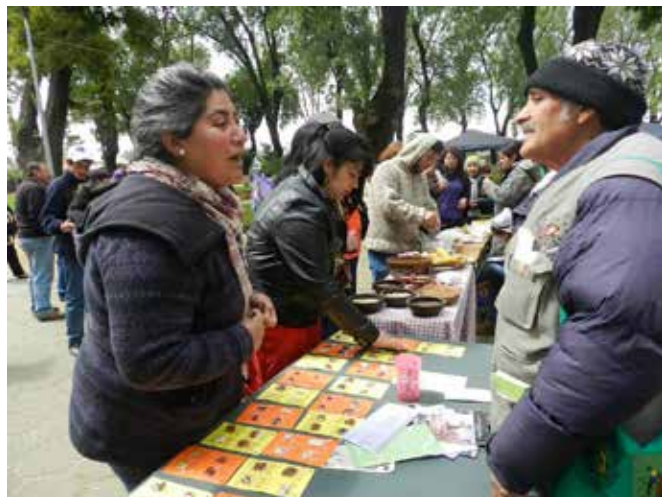
Intercambio de semillas y saberes en cierre de la Escuela Interregional de El Carmen

El equipo de formadoras y formadores fue un equipo interdisciplinario que consideró técnicos y profesionales asociados al agro (veterinarios, agrónomos) y al área social (educadoras, periodistas) todos los cuales cumplen con los perfiles mencionados en el punto 6.1. Del mismo modo y con la finalidad de incorporar la diversidad de saberes y experiencias, fueron parte vital de este equipo dirigentes y dirigentas campesinos y de pueblos originarios