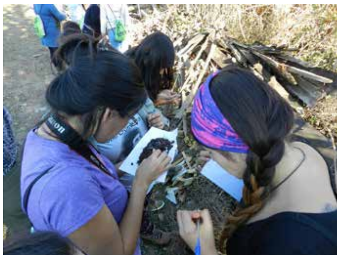
Alumnas observando el suelo de la Casa de ANAMURI en Orilla de Auquenco