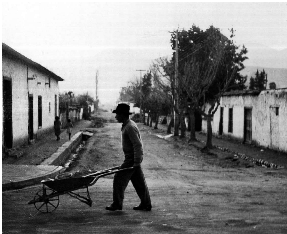
Fotografía: Archivo ANAMURI