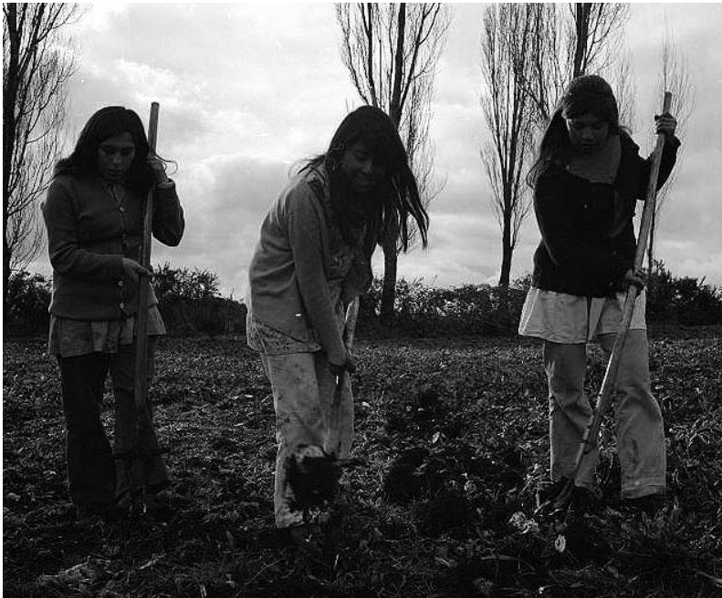
Iansa (Chile), Cosecha de remolacha azucarera en la Planta Llanquihue.