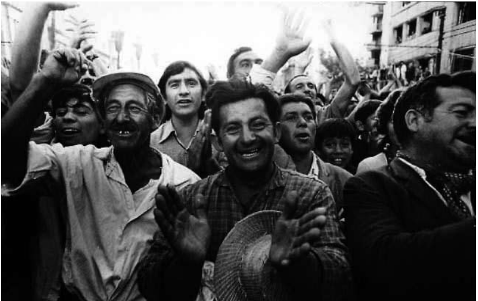
Fotografía: Obreros y campesinos en concentración de la Unidad Popular, 1970. Colección Fundación Salvador Allende (id MC: MC0001771).