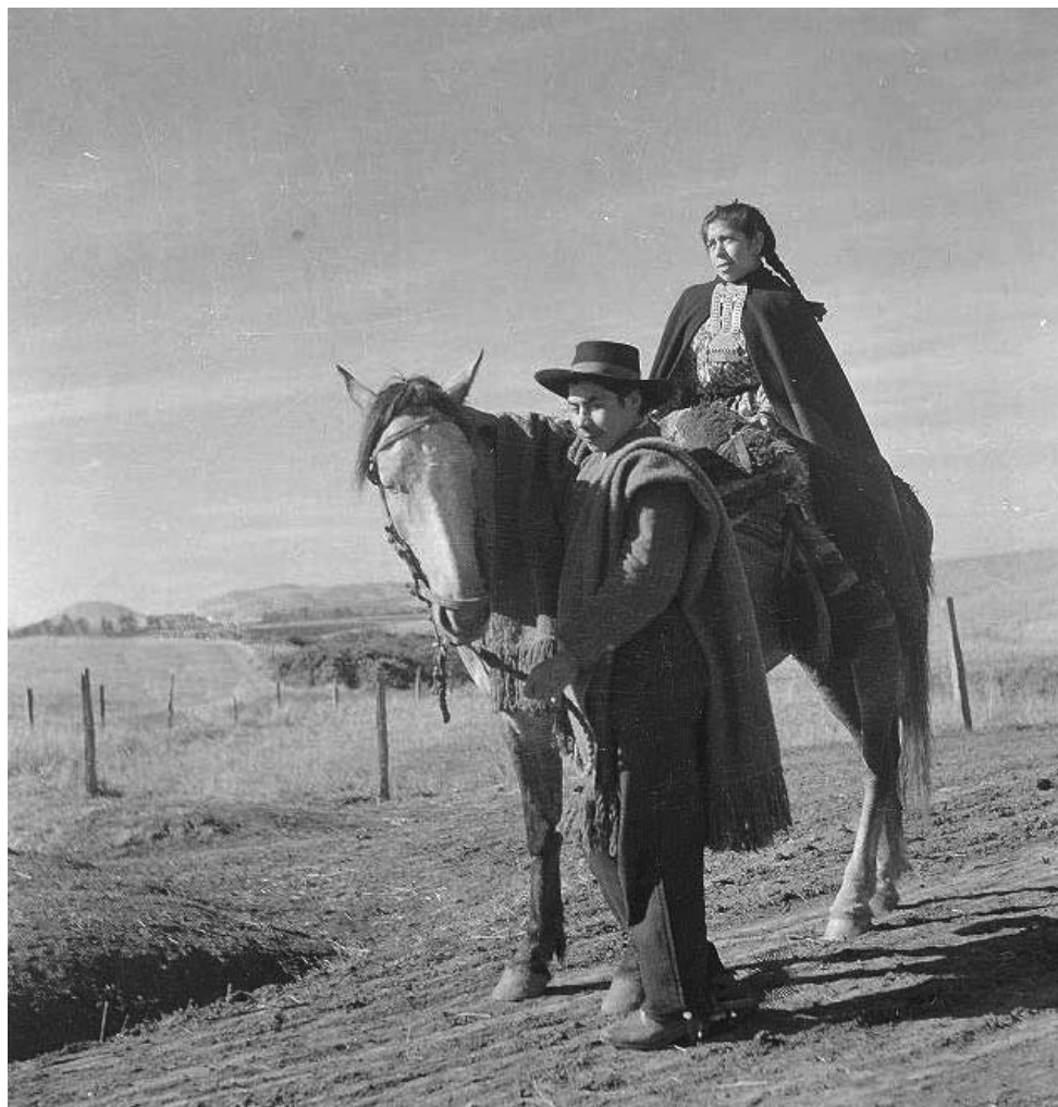
Mujer mapuche a caballo, su marido tira las riendas por un camino rural.