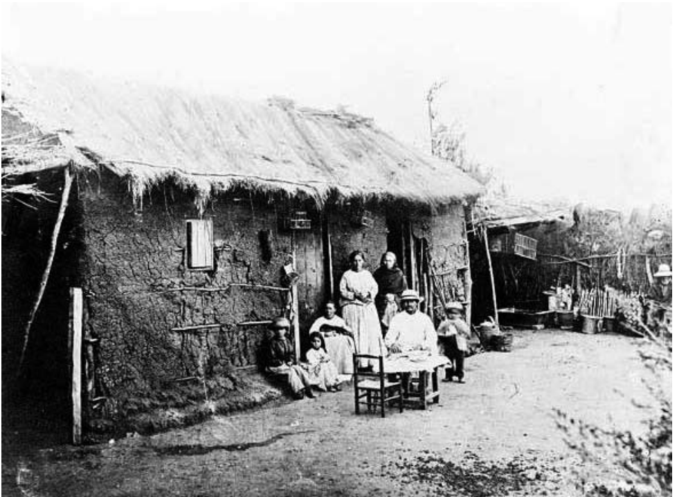
Fotografía: Un Rancho Rural. (ca. 1900) De: R. Lloyd, "Impresiones de la República de Chile", Londres 1915.