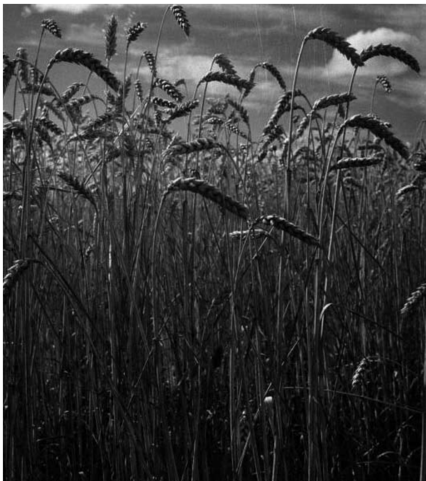
Fotografía: Gavillas de trigo